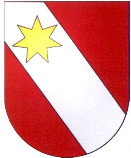
Das Wappen des ehemaligen Amtsbezirks Thun